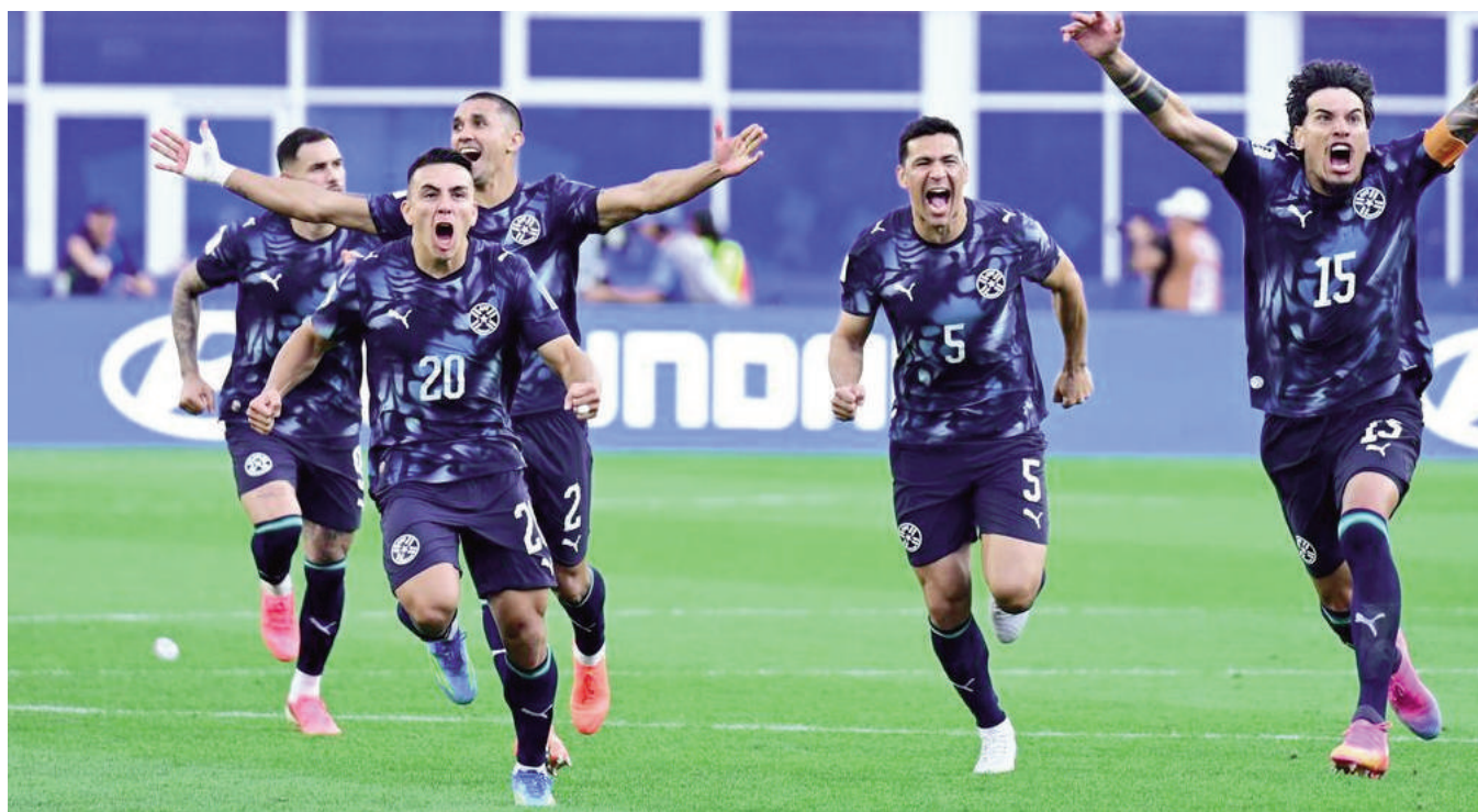
du tournoi (1-1).

Finalement, l'Allemagne a égalisé : Kai Havertz a prolongé un centre de Florian Wirtz pour son troisième but