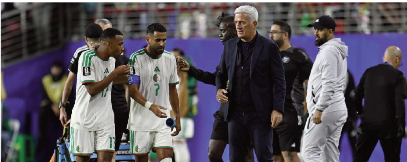
Nouveau groove des Fennecs