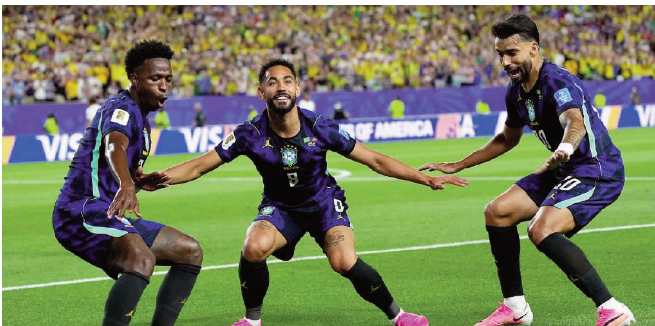
Proche du 3-1

Toujours privé d'un Neymar convalescent, Carlo Ancelotti peut d'ailleurs se réjouir de la grande forme affichée par sa star Vinicius Junior. Déjà buteur face au Maroc, l'attaquant du Real Madrid a récidivé en fin de première période (48e), idéalement lancé par Lucas Paqueta.