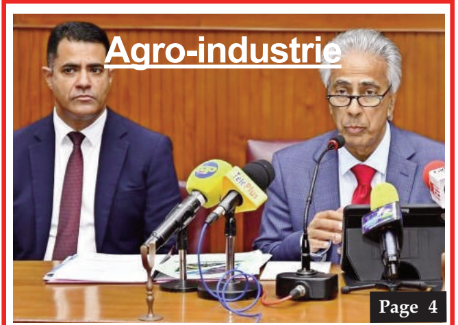
Priorités budgétaires pour renforcer la sécurité alimentaire et la résilience économique Page 4