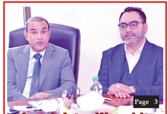
Le ministre Wochit préconise une approche axée sur les résultats pour renforcer gouvernance locale Page 3