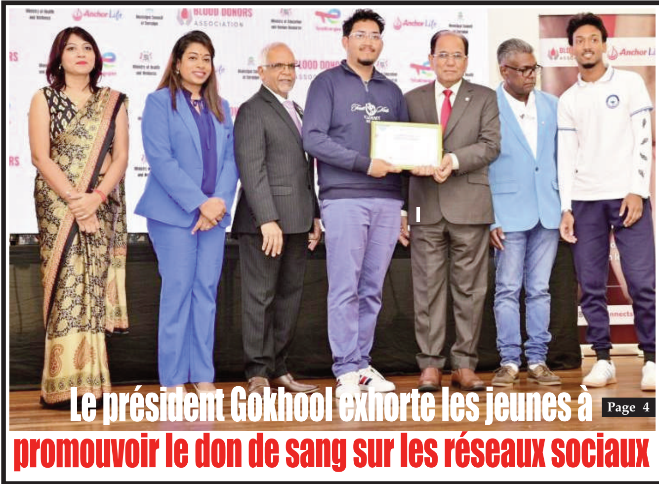
Le président Gokhool exhorte les jeunes à promouvoir le don de sang sur les réseaux sociaux Page 4

Un Quotidien d'information, libre et indépendant