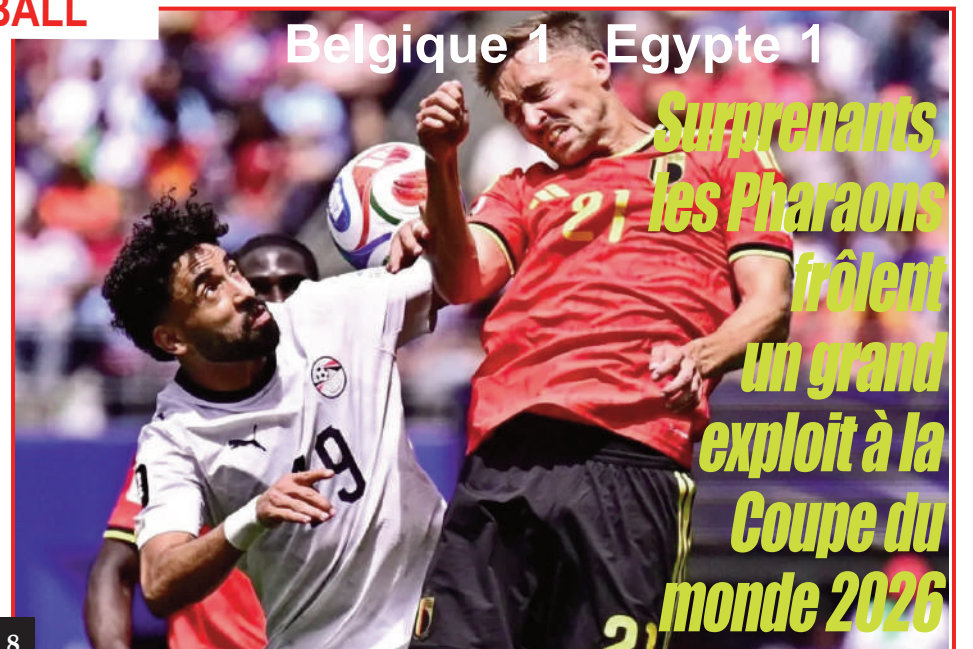
Surprenants, les Pharaons frôlent un grand exploit à la Coupe du monde 2026