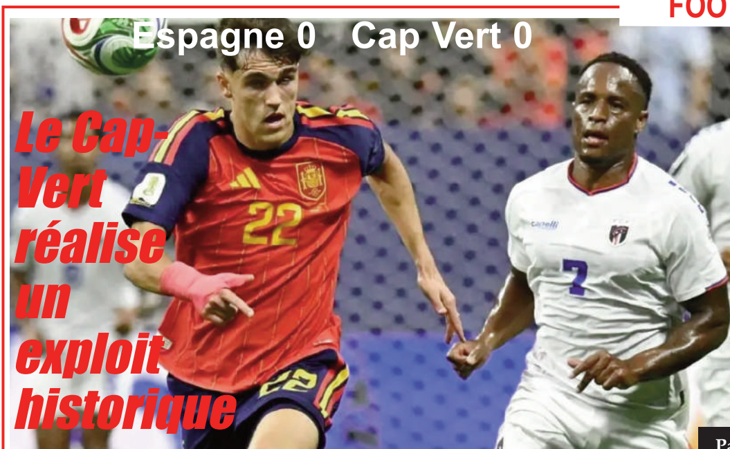
Le Cap-Vert réalise un exploit historique