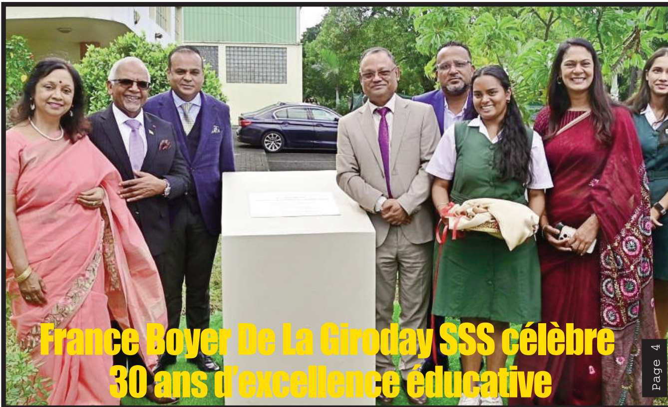
France Boyer De La Giroday SSS célèbre 30 ans d'excellence éducative Page 4