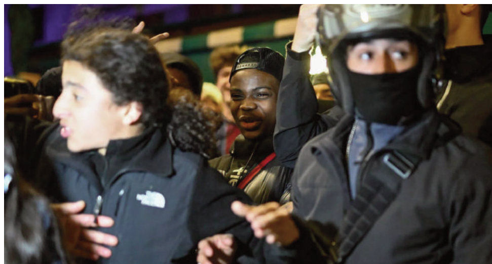
«L'importance de la réponse policière»

C'est une victoire à débordements. Après la qualification du Paris Saint-Germain en finale de la Ligue des champions mercredi soir, avec un nul (1-1) contre le Bayern-Munich, les scènes de joie des célébrations de supporters venus mercredi aux abords du Parc des Princes, à Paris, ont été émaillées de débordements.