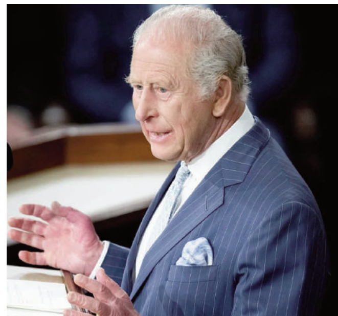
« 21 coups de canon » en l'honneur de Charles III

Le roi a également exhorté les élus américains à faire preuve d'une « détermination sans faille » dans le soutien à l'Ukraine face à la Russie. Cette prise de position intervient alors que plusieurs responsables européens déplorent un désengagement des Etats-Unis, aussi bien sur le terrain militaire que dans les négociations diplomatiques. En ouverture de son discours, Charles III a condamné la violence politique après des tirs survenus lors d'un gala de la presse auquel participait Donald Trump. Selon lui, ces actes visaient à « fomentier davantage la peur et la discorde », assurant que « de tels actes de violence ne réussiront jamais ». Fidèle à ses engagements, il a aussi évoqué la protection de l'environnement.