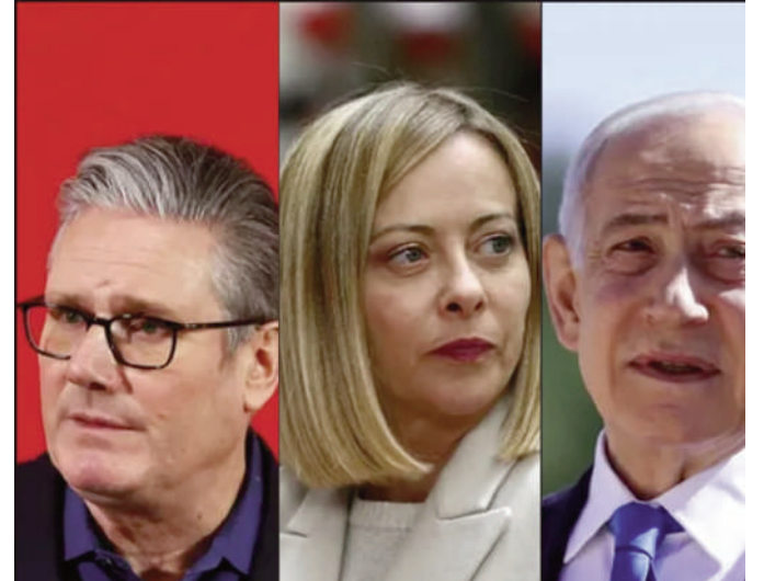
"La violence politique n'a pas sa place dans une démocratie"

MILKYLAND INSTANT FILLED MILK POWDER 1KG – Rs 243.87 SEVEN SEVEN CO LTD, ROYAL ROAD, MONT FERTILE, ROSE BELLE TEL 6275860 - Email:info@dreamprice.mu