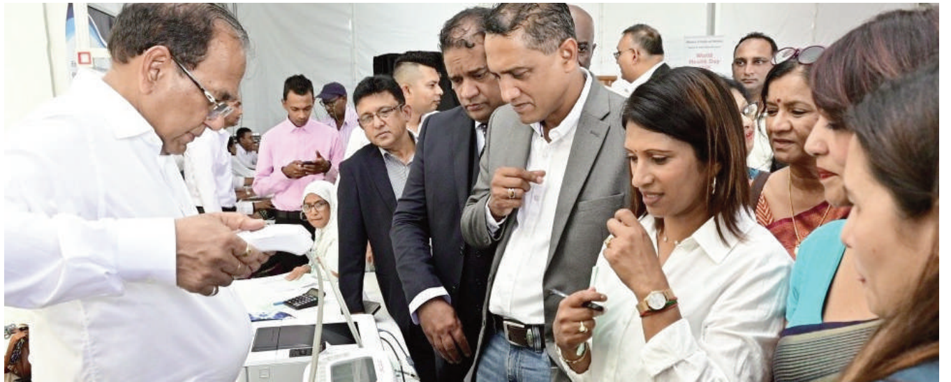
èle des assiettes alimentaires et des séances d'éducation à la santé.

Le programme vise à rapprocher les services de santé essentiels des communautés tout en favorisant une culture de prévention et de détection précoce. Il comprend une gamme d'activités telles que le dépistage des MNT – tests de diabète, surveillance de la pression artérielle, analyse de l'indice de masse corporelle et de la composition corporelle, tests de vision et consultations médicales – ainsi que le dépistage du cancer du sein et du col de l'utérus, la sensibilisation à la nutrition par le biais du mod-