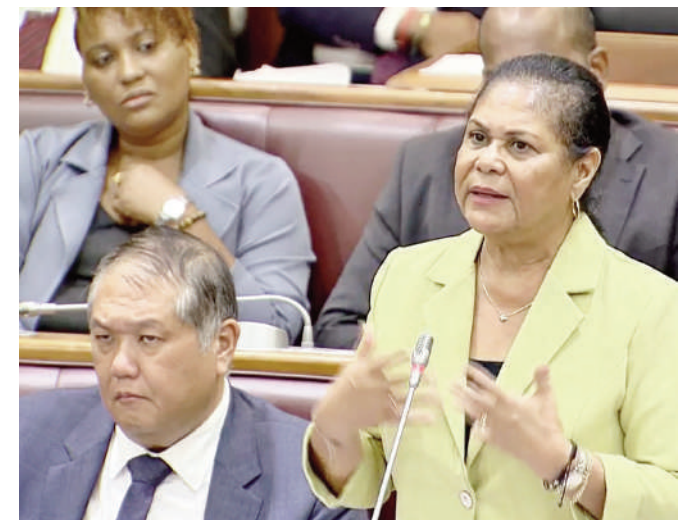
nu comme une crise des droits de l'homme à Maurice, plutôt que comme des incidents isolés.

La législation, a souligné la ministre Navarre-Marie, sera encore renforcée par des amendements au Code pénal concernant les cas de féminicides. Se référant au rapport annuel 2025 de la Commission nationale des droits de l'homme, elle a souligné que le féminicide devait être recon-