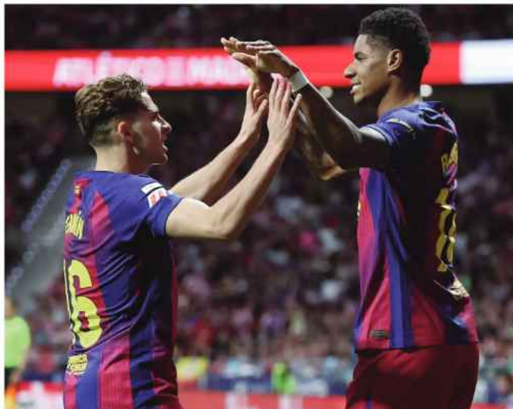
Barcelone de s'en tirer à bon compte.

Peu après la reprise, le Barça a failli se retrouver lui aussi à dix. Gerard Martin a continué sa course après une passe et a percuté de plein fouet le pied de son adversaire. Après intervention du VAR, ce carton a toutefois été transformé en carton jaune, ce qui a permis à