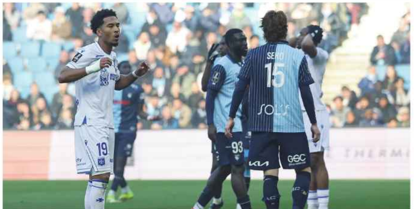
Ce dimanche en Ligue 1, Auxerre et Le Havre se sont séparés sur un match nul 1-1, dans une rencontre cruciale pour la lutte pour le maintien. Les Bourguignons auraient pu espérer repartir avec la victoire de Normandie.

Auxerre frustré par Le Havre, Metz maudit