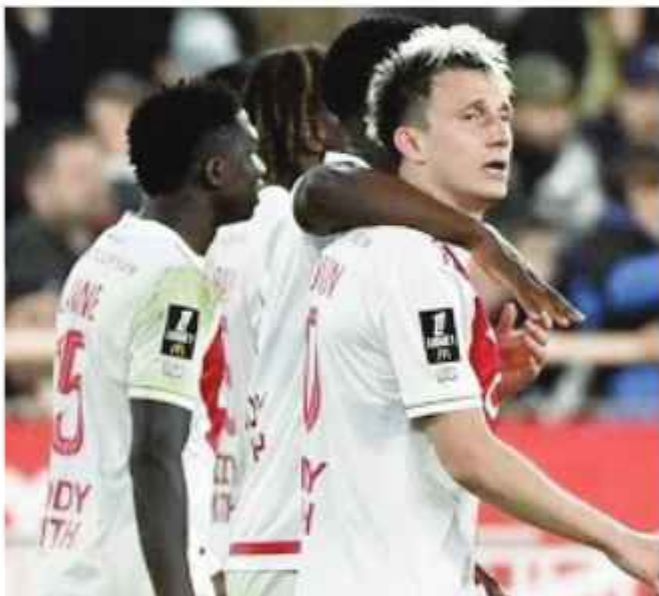
Dans un match très disputé, les joueurs de la Principauté ont fait la différence grâce à des buts de Golovin et Balogun.

Monaco s'impose face à Marseille et signe un 7e succès consécutif en championnat