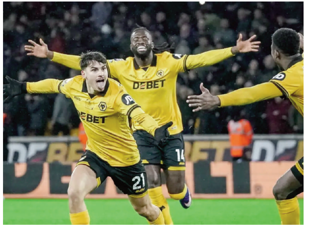
Les Wolves, eux, signent leur seconde victoire de la saison (pour 20 défaites) mais restent loin, très loin du maintien. Ils sont à 14 points du barragiste, Nottingham Forest.

Ils pourraient même perdre leur place sur le podium en fonction du résultat de Manchester United (4e, 48 pts) qui reçoit dimanche Crystal Palace. Manchester City (2e, 56 pts), qui se déplace samedi sur la pelouse de Leeds, aura l'occasion de les mettre à huit points. Le leader, Arsenal (61 pts), recevra lui Chelsea (5e, 45 pts) en clôture de la 28e journée de Premier League.