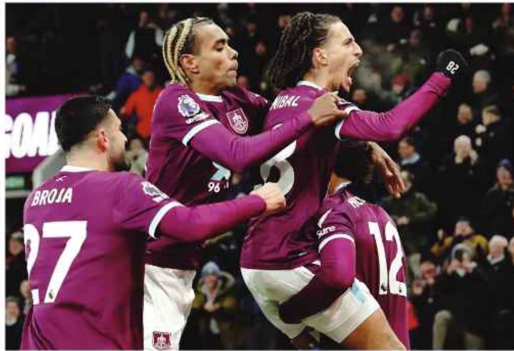
MU a cru tout renverser

Est-ce le manque de repères introduit par ce nouveau système de jeu ? Toujours est-il qu'au bout de 13 minutes, MU était mené 0-1. Parti côté gauche dans le dos de Casemiro, Bashir Humphreys voyait son centre dévié du bout du pied par Ayden Heaven qui lobait l'infortuné Senne Lammens.