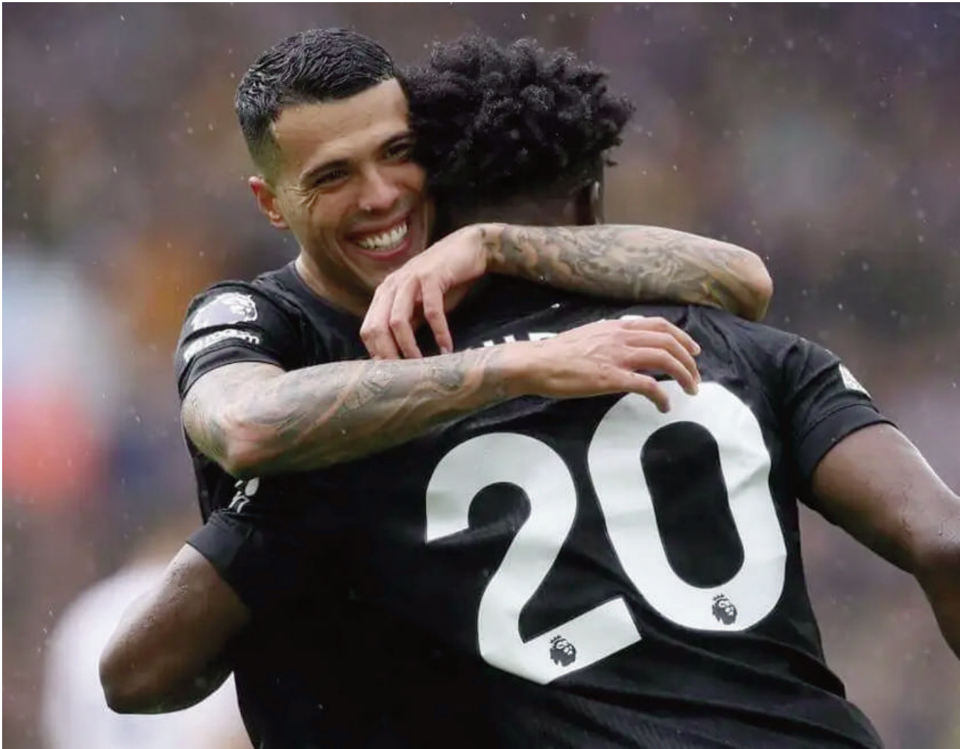
championnat, contre Brighton et Wolverhampton. Ils recevront Aston Villa après la trêve internationale, juste avant un déplacement à Monaco en Ligue des champions.

Les Spurs restaient sur deux matches nuls en