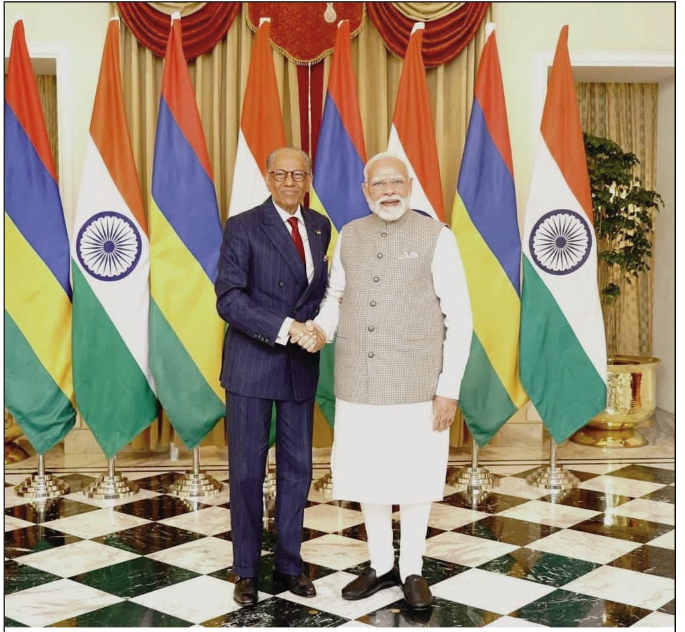
Le Premier ministre Narendra Modi avec son homologue Navinchandra Ramgoolam lors d'une réunion bilatérale, à Varanasi.

Il a déclaré qu'il s'était rendu à Maurice en mars de cette année pour assister aux célébrations de la fête nationale de Maurice.