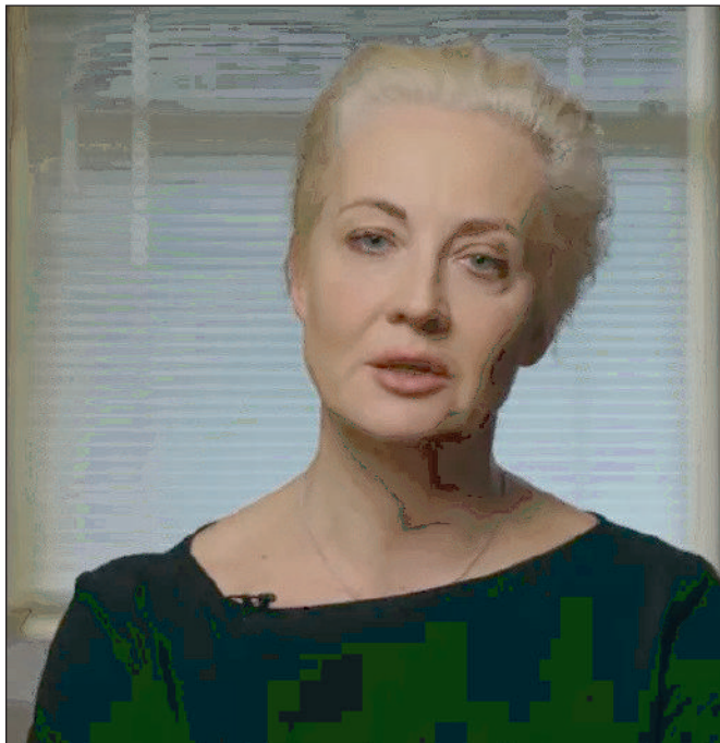
Ioulia Navalnaïa, veuve du chef de file de l'opposition russe Alexeï Navalny, mort en prison l'an dernier, a déclaré mercredi que des tests effectués par des labora-

toires étrangers sur des échantillons biologiques prélevés sur son mari montraient qu'il avait été empoisonné.