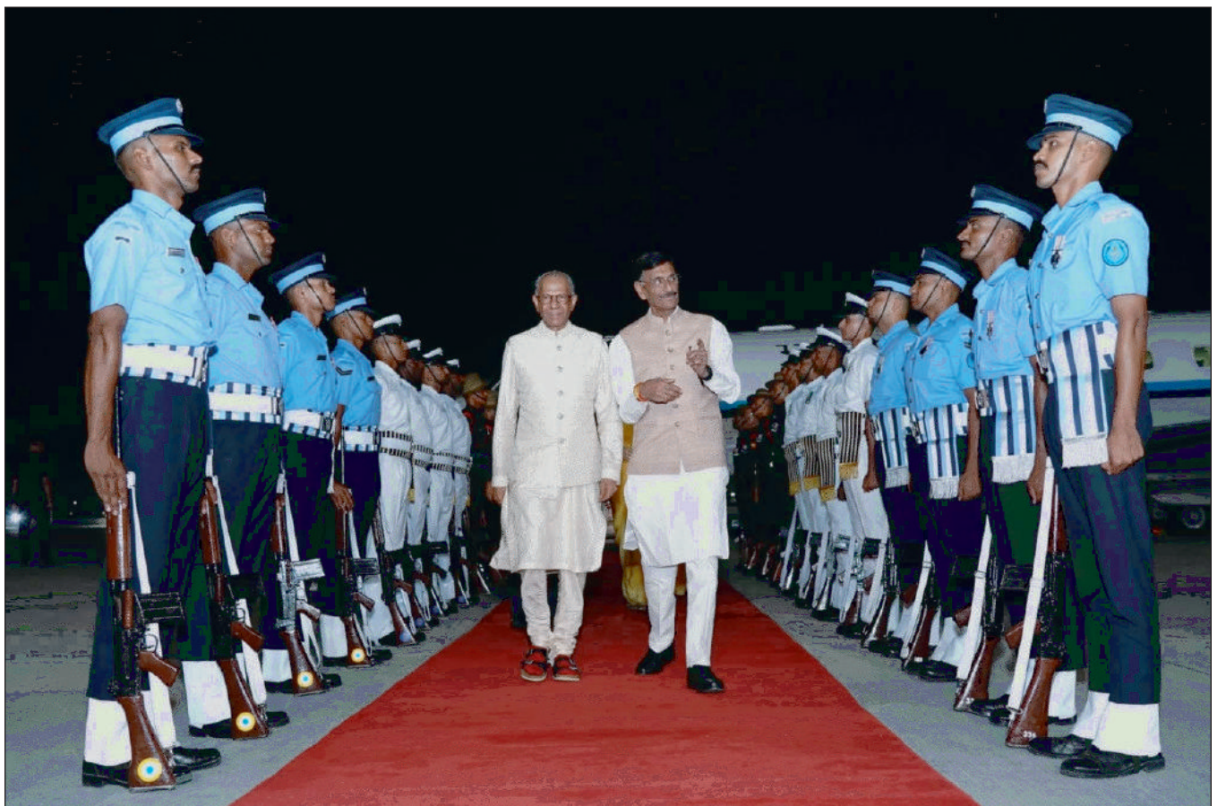
Le Dr Navin Ramgoolam à son arrivée à Delhi. Il a été accueilli par le ministre de la Défense indien, M. Sanjay Seth

L e Premier ministre, le Dr Navin Ramgoolam à son arrivée à New Delhi a été accueilli par le ministre d'État à la Défense. Il a ensuite rendu hommage à Mahatma Gandhi au Rajghat et s'est rendu au Sadaiv Atal pour rendre hommage à l'ancien Premier ministre Atal Bihari Vajpayee.