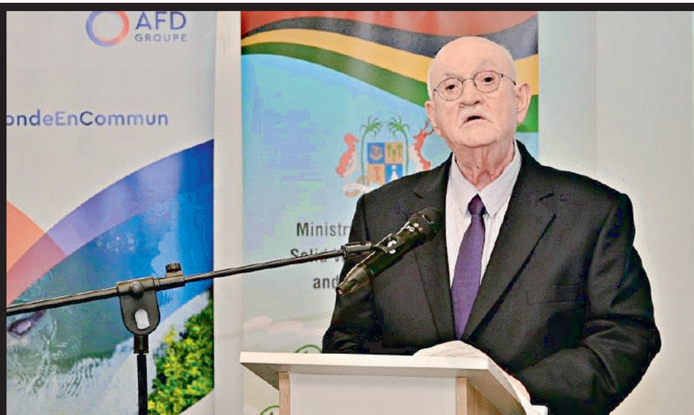
GESTION DES DÉCHETS Le ministre de l'Environnement appelle à des pratiques responsables pour une Maurice durable