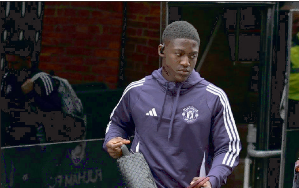
Selon talkSPORT, Kobbie Mainoo envisage de quitter Manchester United au