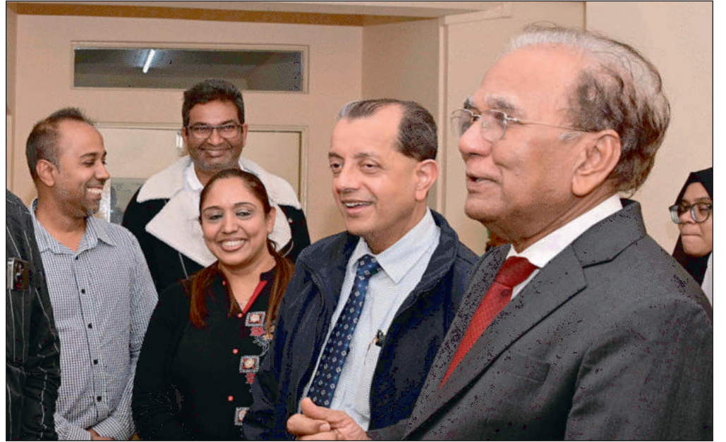
pour traiter les cas de handicap grave et où nous pouvons mettre notre expérience au service des patients mauriciens », a-t-il déclaré.