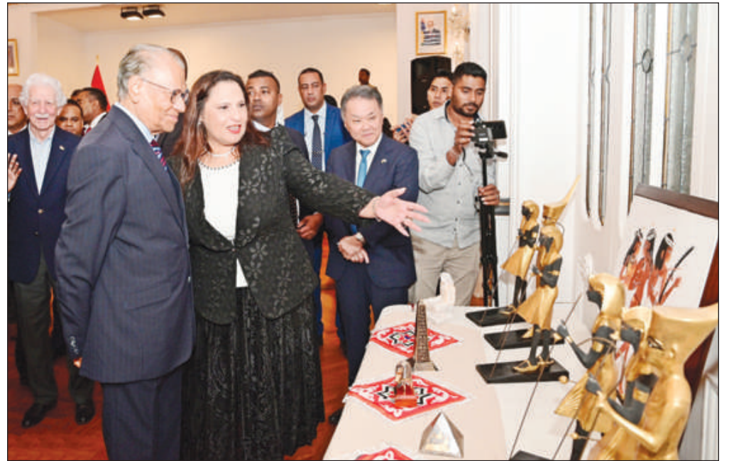
perspectives qui soutiennent le développement durable et collaborer pour relever les défis mondiaux.

L'Égypte et Maurice ont le potentiel de renforcer leur collaboration dans les secteurs de l'éducation, de la recherche scientifique, de la culture, de la technologie et des services publics, a-t-elle déclaré, ajoutant qu'en établissant des partenariats solides, nous pouvons ouvrir de nouvelles