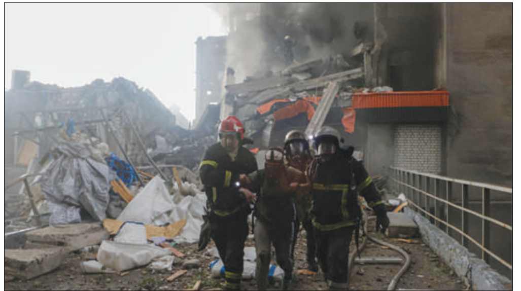
tion de Starokostiantyniv.

«La destination principale de la frappe était la ville de Starokostiantyniv, dans la région de Khmelnytsky», a ajouté l'armée de l'air. Située dans l'ouest du pays, à des centaines de kilomètres du front, cette ville abrite un important aérodrome militaire et est très régulièrement visée par les attaques aériennes russes. Le porte-parole de l'armée de l'air, Iouri Ignat, a ensuite précisé que des missiles hypersoniques russes Kinjal «volaient justement» en direc-