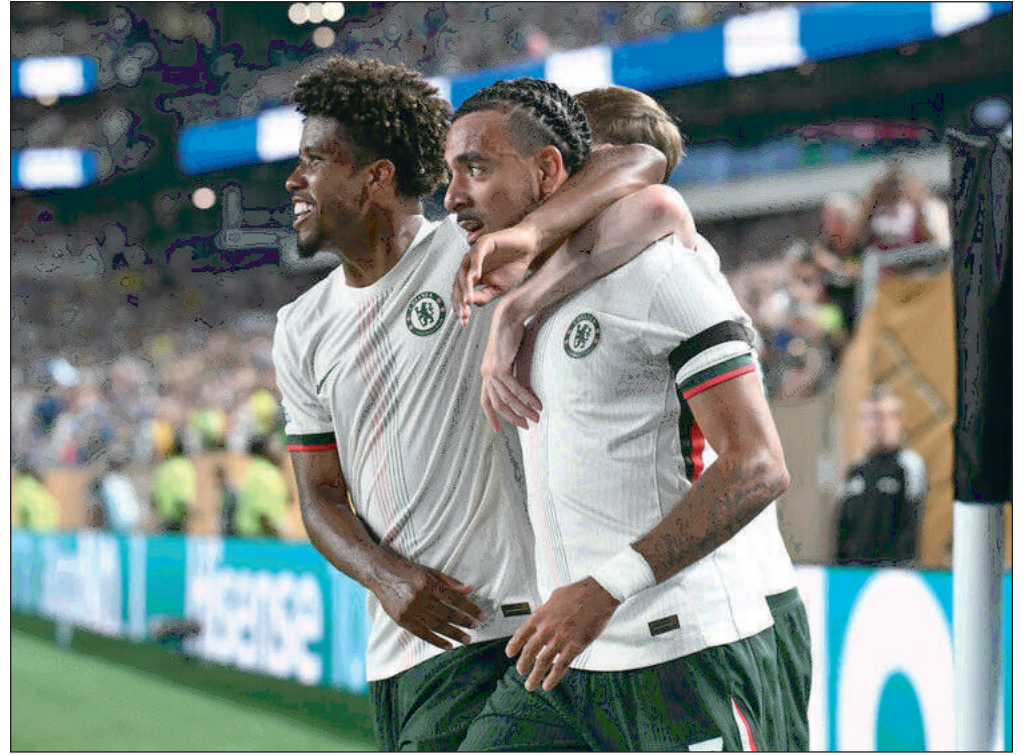
équipes promenaient le ballon d'un bout à l'autre du terrain. Les occasions franches n'ont pas été légion, cependant, avec notamment un tir d'Allan qui a frôlé le poteau (65e) et une frappe au-dessus de Marc Cucurella (74e).

Le match était alors enfin lancé, et les