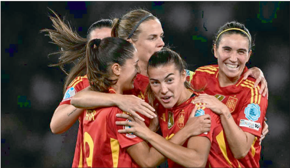
scelle le succès espagnol avec son quatrième but du tournoi, sur une nouvelle passe de Putellas (3-1, 90e+1).

En deuxième mi-temps, Patri Guijarro a donné l'avantage aux Espagnoles d'une frappe lointaine au ras du poteau gauche (2-1, 48e), avant qu'Esther Gonzalez ne