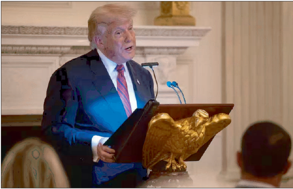
Le président américain, Donald Trump, s'est réjoui des «grandes choses» accomplies depuis le début de son deux-