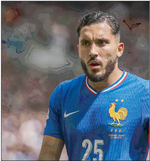
un joueur qui était sous contrat dans le Rhône jusqu'en 2026.

ma carrière ici est quelque chose de très, très spécial » « C'est un rêve pour moi. Honnêtement, rejoindre un club comme Manchester City et avoir l'opportunité de franchir une nouvelle étape dans ma carrière ici est quelque chose de très, très spécial », a réagi l'ancien Lyonnais. « Nous sommes très heureux d'avoir Rayan à City. Nous souhaitons attirer les meilleurs talents au club, et il en fait partie », a de son côté savouré le directeur sportif de Manchester City, Hugo Viana. L'OL doit récupérer un peu plus de 40 millions d'euros dans cette opération, liée à