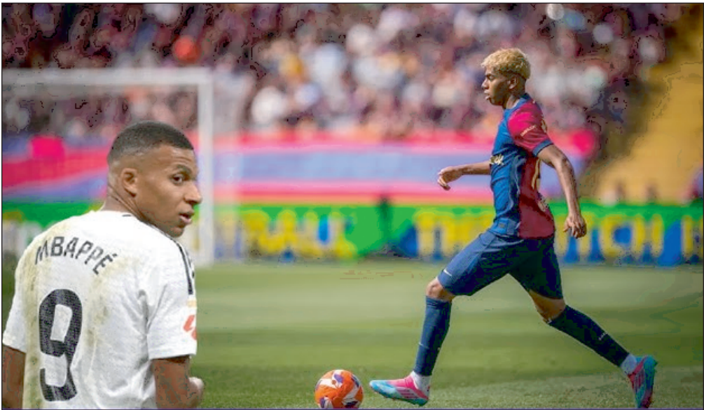
La stat' : 39

Alors, quand Barcelone se cherche un sauveur, un gamin de 17 ans, la crinière dorée fouettée par le vent, sort de l'ombre, enchante les foules et prend les choses en main. Un but, une de ses spéciales, un ballon enroulé du gauche depuis une position arrêtée. Un écrin qui rappelle celui inscrit contre l'Inter lors de la demi-finale aller. Une fois les Barcelonais revenus au contact, les Merengue ont laissé de plus en plus d'espace entre les lignes, ce qui a précipité leur perte.