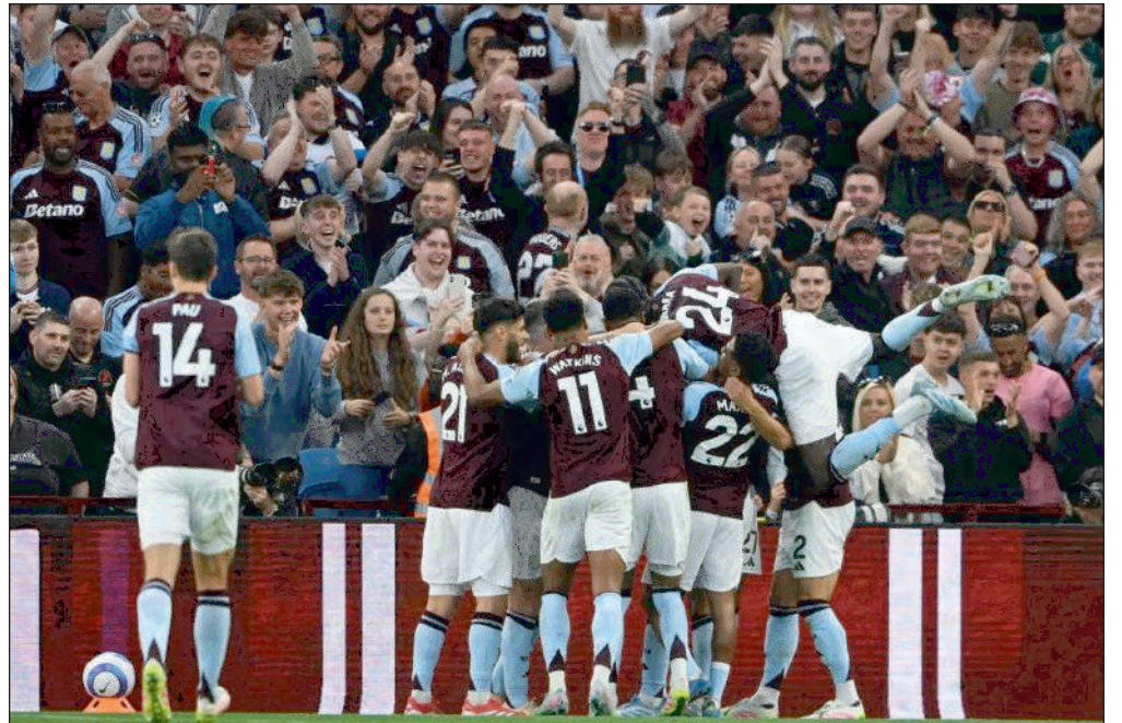
pétitions européennes la saison prochaine lors de l'ultime journée de Premier League

Grâce à ce succès, Aston Villa conserve toutes ses chances d'intégrer le top 5 et compte une unité de plus que Manchester City, qui accueillera Bournemouth mardi après la finale de Cup ce samedi (17h30). Éliminé en quarts de finale de Ligue des champions par le Paris Saint-Germain, le club de Birmingham pourrait décrocher une place pour la plus prestigieuse des com-