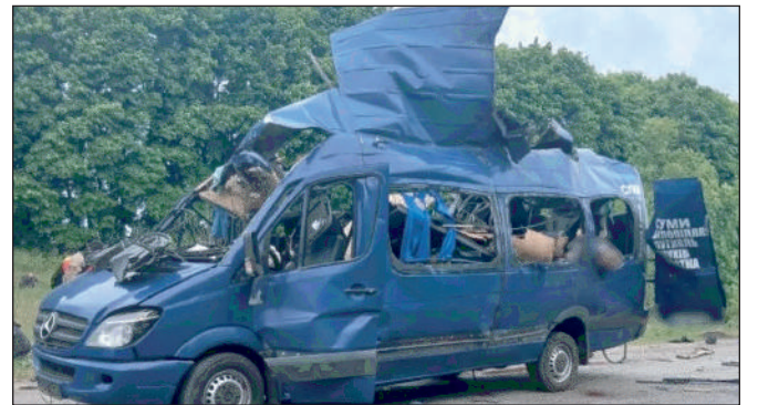
drones Geran-2 ont frappé un point de déploiement temporaire d'équipements militaires de la 82e brigade d'assaut aérien des Forces armées de l'Ukraine".

Le ministère russe de la Défense samedi soir, a fait état de la frappe dans la région de Soumy, affirmant que "des