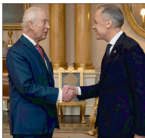
aux provinces, a déclaré le roi Charles III.