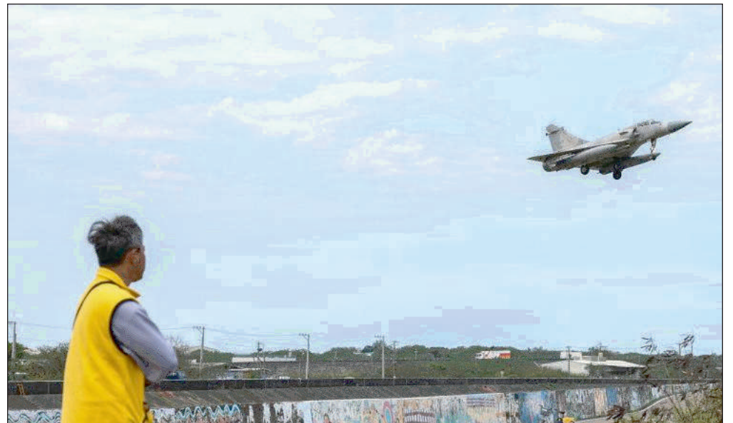
tantes manœuvres simulant un blocus de l'île qu'elle revendique – une démonstration de force condamnée par Washington et l'Union européenne.

La Chine a lancé mercredi un nouvel exercice militaire de grande ampleur dans le détroit de Taïwan, au lendemain d'impor-