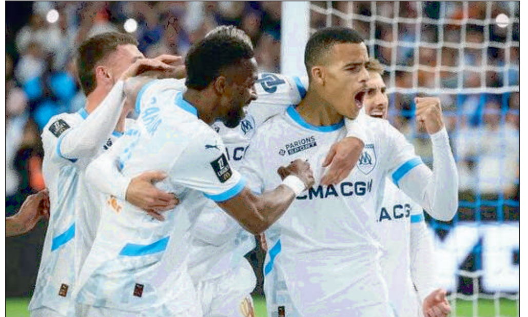
Le Havre, le barragiste, à quatre journées de la fin du championnat, il faudrait un miracle

Grâce à cette victoire, Marseille reprend sa place de dauphin du PSG. Les Monégasques qui avaient doublé les Marseillais la semaine dernière, n'ont pas pu faire mieux qu'un match nul contre Strasbourg ce samedi (0-0). En bas de classement, Montpellier est plus que jamais lanterne rouge. Avec 12 points de retard sur