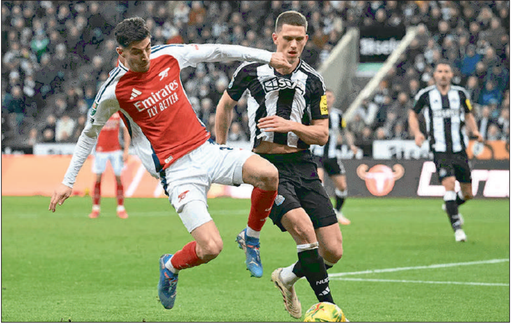
Il ne s'agit pas simplement de réparer sa défaite face à Manchester United à Wembley en finale de cette même compétition il y a deux ans. Il s'agit de la rédemption de 56 ans en tant qu'étrangers, alors que les gros prix étaient collectés ailleurs.

Le bruit a résonné jusque tard dans la nuit alors que Newcastle va maintenant tenter de raconter une histoire différente de l'histoire de l'échec de Wembley qui les a vu perdre cinq finales depuis que Manchester City a été battu 3-1 en finale de la FA Cup 1955.