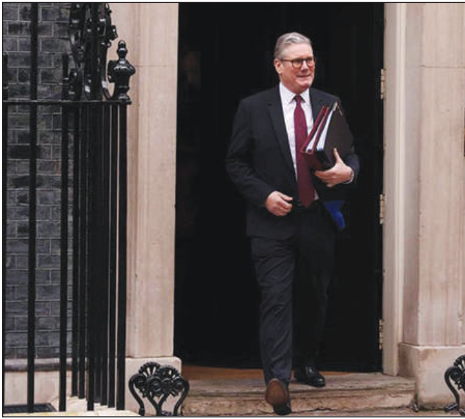
Le Premier ministre britannique Keir Starmer a appelé lundi les Etats-Unis à fournir « une garantie de sécurité