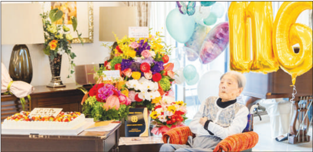
Plus de 95.000 centenaires au Japon

Décédée en 1997, la Française Jeanne Calment, qui a vécu jusqu'à 122 ans et 164 jours, est la personne la plus âgée au monde connue à ce jour, selon le site du Guinness World Records. "Plusieurs personnes ont affirmé être plus âgées que Jeanne Calment mais il n'y a jamais eu assez de preuves pour en avoir la certitude", selon le site.