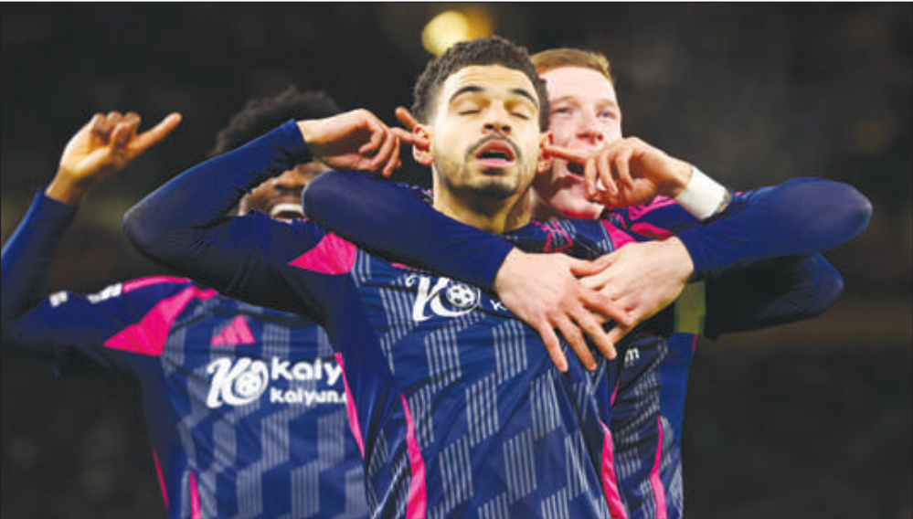
Nottingham Forest, prétendants au titre ?

Nottingham Forest est passé à égalité de points avec Arsenal dans le top trois de la Premier League alors que les buts de Morgan Gibbs-White, Chris Wood et Taiwo Awoniyi leur ont valu une victoire 3-0 à l'extérieur contre les Wolves. Seul Liverpool a remporté plus de matchs en Premier League cette saison que l'équipe de Forest de Nuno Espirito Santo, qui a remporté sa 12e victoire de la saison avec une performance impitoyable à Molineux, punissant l'équipe locale à deux reprises à la pause en première mi-temps avant de fermer le score. Le match a été