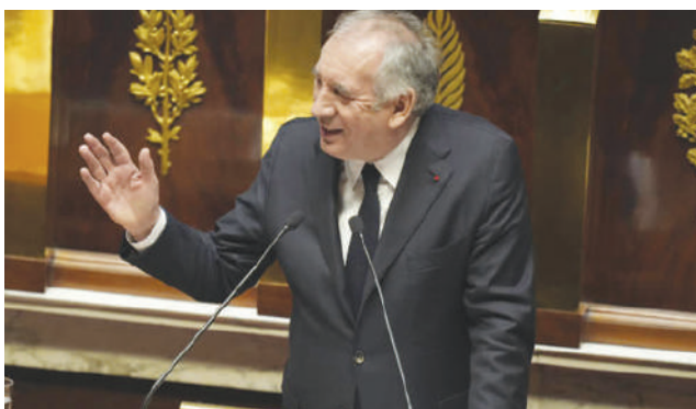
Avec son discours de politique générale, François Bayrou a-t-il bougé les lignes à l'Assemblée ?