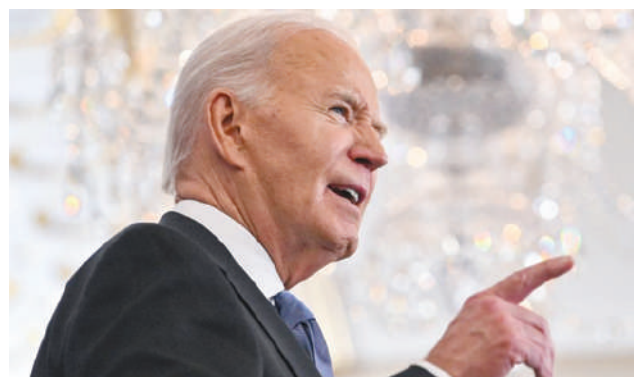
Un accord sur une trêve à Gaza possible «cette semaine»