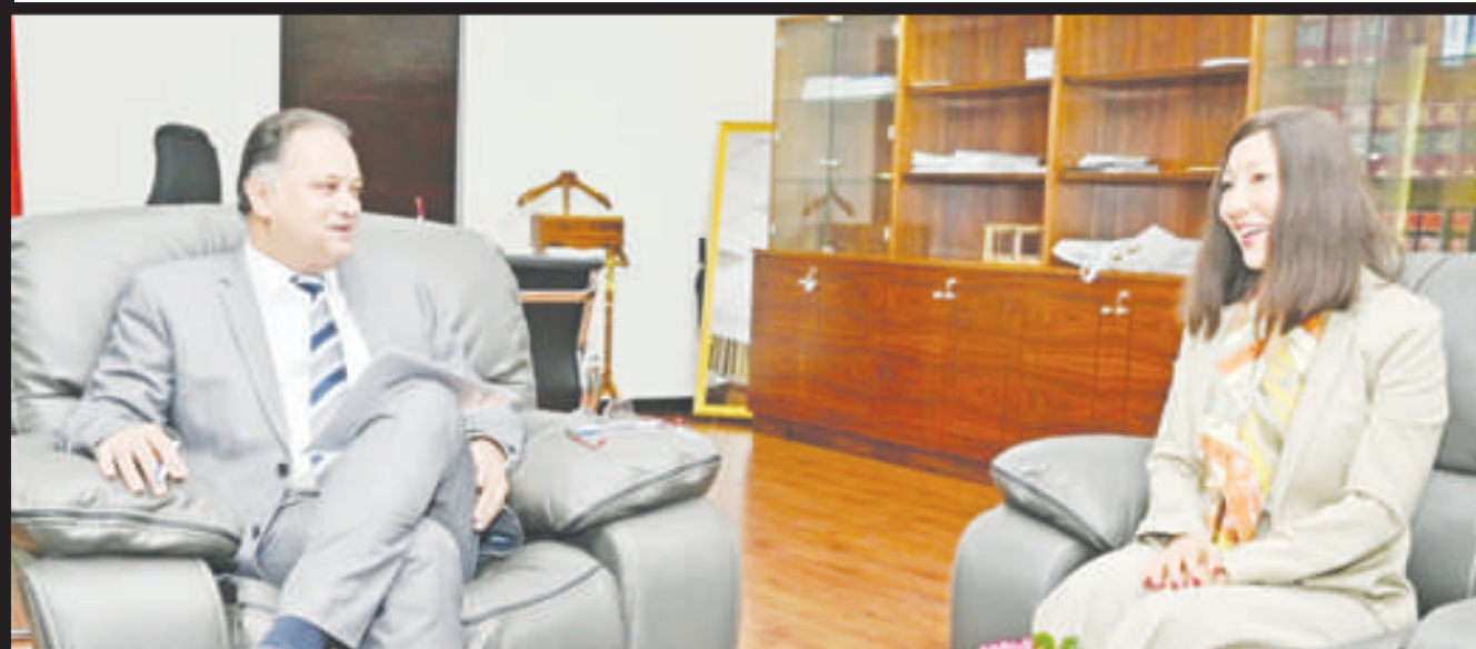
Renforcer la collaboration entre l'ONU et le ministère de l'Industrie, des PME et des Coopératives