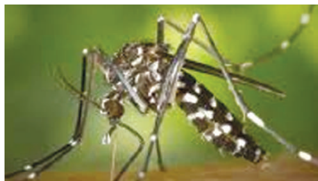
A la Réunion, L'épidémie de chikungunya déclarée et le dispositif de gestion de crise déclenché