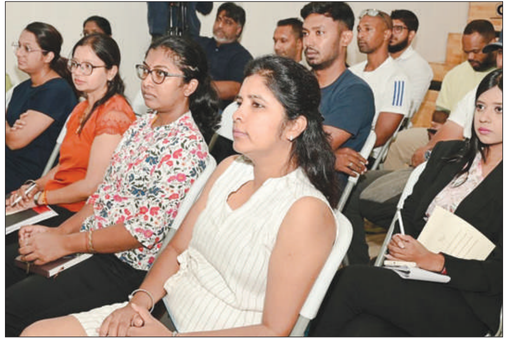
une façon de penser optimiste.

Mindset Coaching vise également à aider les gens à atteindre les objectifs souhaités en adoptant et en envisageant