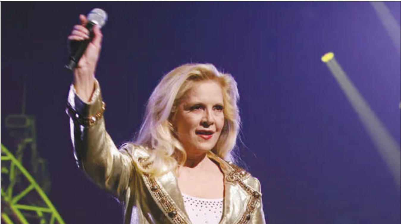
Figure emblématique du yéyé, Sylvie Vartan a annoncé la fin de sa carrière musicale. Pour ses adieux, la chanteuse a prévu des souvenirs mémorables pour ses fans...

15:22 BABY EINSTEIN 2 15:28 LES AVENTURES DU PETIT PINGOUIN 17:52 KIKA ET BOB 18:48 HEALTHY LIVING 19:03 RED CARPET 19:18 STUDENT SUPPORT PROG 19:53 GLOBAL US 20:24 LE TEMPS D'AIMER 20:52 NEWS 21:12 TOP DIVE SITES 21:39 THE PLEASANT VALLEY WAR 22:48 INITIATIVE AFRICA 23:14 EUROMAXX 23:25 A WORLD HERITAGE SITE IN DANGER? SOUTH TYROL FIGHTS FOR ITS FUTURE