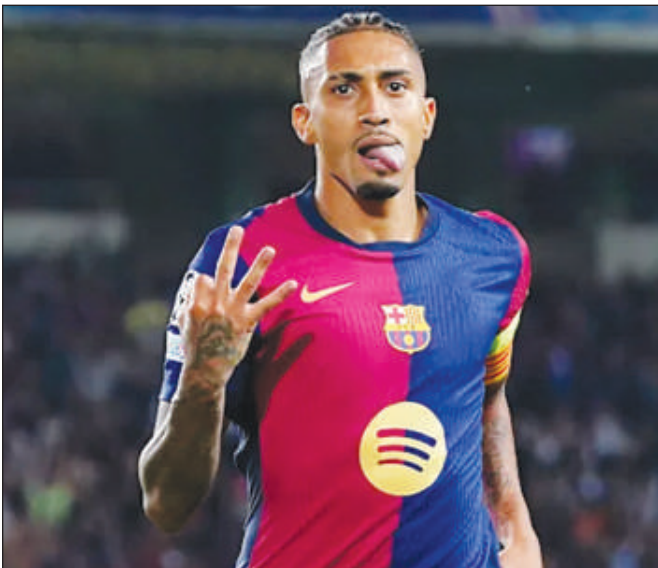
occupe la 23e place du classement de la Ligue des champions. Le FC Barcelone grimpe quant à lui à la 10e place.

Le Bayern n'a que trois points en trois matches et