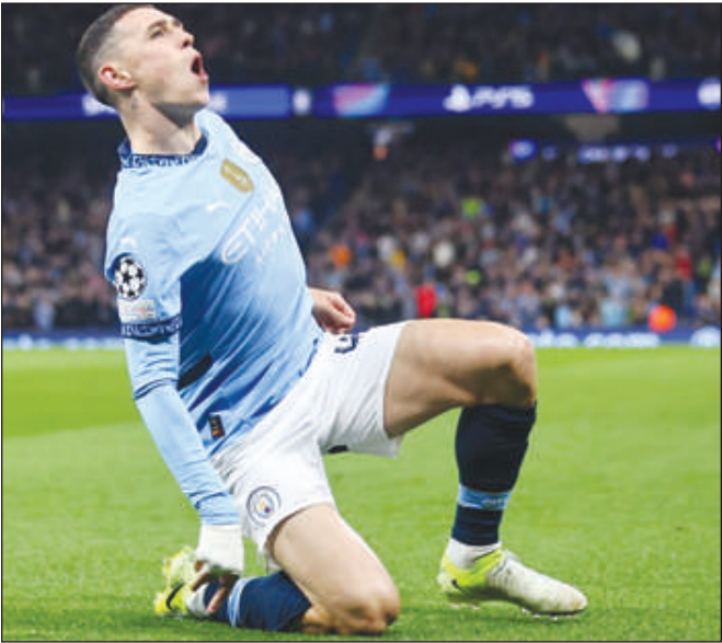
Manchester City a déroulé mercredi à domicile face au Sparta Prague (5-0), débutant bien la rencontre avant de mettre un coup d'accélérateur à l'heure de jeu. Liverpool

a également gagné, lors de cette 3e journée de la Ligue des champions, à Leipzig (0-1), poursuivant son sans-faute. Marcus Thuram a quant à lui inscrit le but de la victoire de l'Inter à Berne (0-1), dans le temps additionnel.