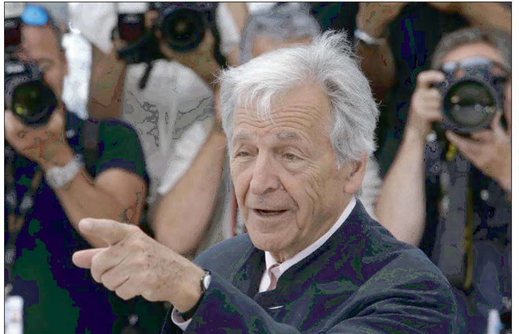
Agnès Jaoui et au réalisateur britannique Christopher Nolan.

La 49e édition avait vu le triomphe d' Anatomie d'une chute , de Justine Triet (César du meilleur film et de la meilleure réalisation). Le César d'honneur, qui récompense l'ensemble d'une carrière, avait été remis à la réalisatrice et actrice française