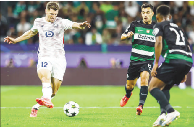
Deux frappes cadrées contre 19 tirs

Le premier coup dur est venu de l'attaquant suédois Viktor Gyökeres. Il a ouvert le score d'une frappe puissante après une intervention défensive mal maîtrisée d'Alexsandro. Auteur de huit buts en championnat, Viktor Gyökeres avait été identifié par Bruno Génésio comme « un des meilleurs avants-centres d'Europe ». Son impact sur le match a été immédiat, non seulement avec son but, mais aussi par son rôle dans l'expulsion d'Angel Gomes. Ce dernier a reçu un deuxième carton jaune à la 40e minute pour une faute évitable sur l'attaquant.