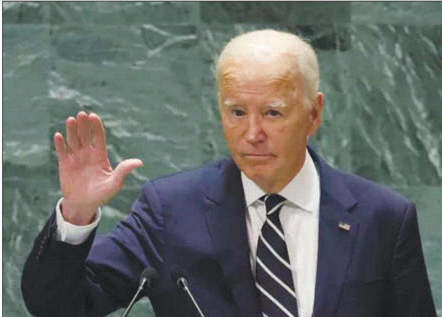
président américain, dont c'était le dernier discours devant les dirigeants du monde entier.

«J'ai décidé qu'après 50 ans de service public, il était temps qu'une nouvelle génération de dirigeants publics fasse avancer mon pays. Mes collègues dirigeants, n'oublions jamais que certaines choses sont plus importantes que de rester au pouvoir. C'est votre peuple», a-t-il affirmé sous les applaudissements. «N'oubliez jamais que nous sommes ici pour servir le peuple, et non l'inverse», a ajouté le