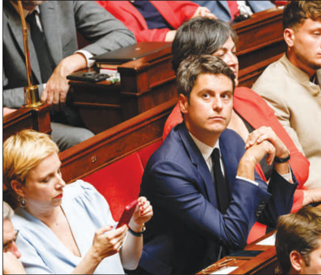
Des lettres d'Horizons et du NFP

Autant de points qui constituent « la base sur laquelle nous sommes prêts à engager des discussions » avec les autres partis, écrit le premier ministre démissionnaire et président du groupe macroniste à l'Assemblée. Gabriel Attal rappelle toutefois que cette main tendue ne concerne que les « forces politiques allant de la gauche républicaine à la droite républicaine », renvoyant une fois de plus dos à dos LFI et le RN hors de « l'arc républicain », un concept défendu par son camp.