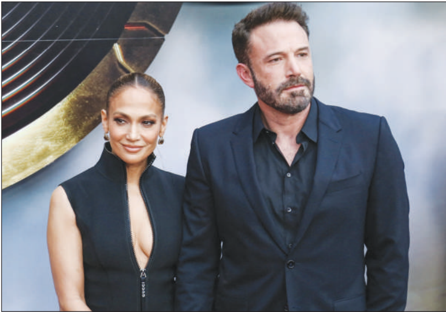
Jennifer Lopez a le "cœur brisé"