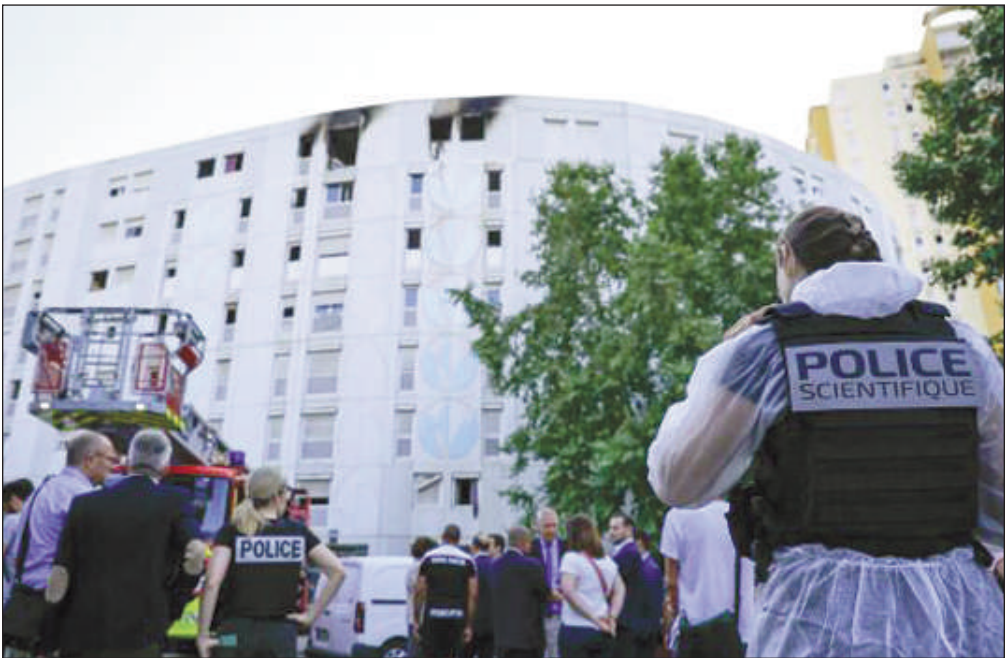
de la politique de la ville, les Moulins, dans l'ouest de Nice, sont gangrenés par le trafic de drogue et ont connu de nombreux

Le procureur a demandé « une particulière prudence sur le mobile » de cet acte criminel mais a aussi confirmé explorer la piste « de faits intervenant dans le cadre d'un conflit sur fond de trafic de stupéfiants », mais « sans lien avec les victimes et leur famille ». Classés quartier prioritaire