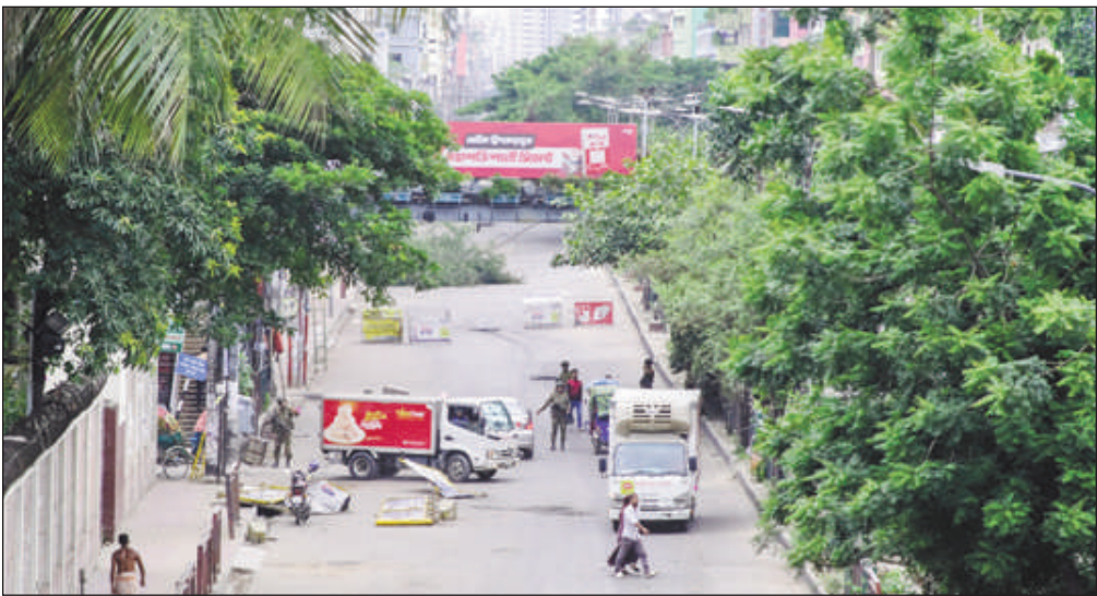
l'indépendance du pays en 1971.

Une réforme de quotas d'embauche dans la fonction publique a déclenché cette contestation. En juin, le gouvernement a voulu réintroduire un système de quotas pour accéder aux postes de fonctionnaires, et réserver un tiers des emplois aux descendants de ceux qui ont combattu pour