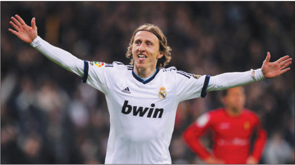
39 ans, a été poussé l'an dernier sur le banc du milieu de terrain anglais Jude Bellingham. Il reste cependant très apprécié

L'international croate, qui aura bientôt