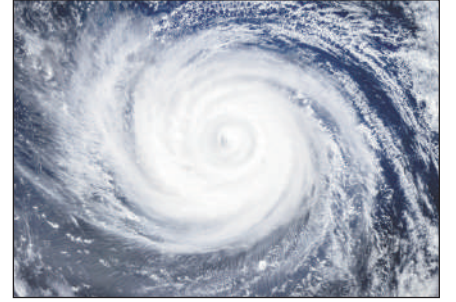
Peut-être un deuxième ouragan dès la semaine prochaine

Dimanche en milieu de journée, la Martinique est placée en vigilance cyclonique jaune par Météo France. Il reste trois niveaux de plus à activer potentiellement, le plus élevé correspondant au confinement. Si la zone la plus violente de Beryl passera au large de la Martinique, l'organisme météorologique anticipe « une nette dégradation des conditions météorologiques, dont l'intensité sera conditionnée par la distance » avec l'œil du cyclone.