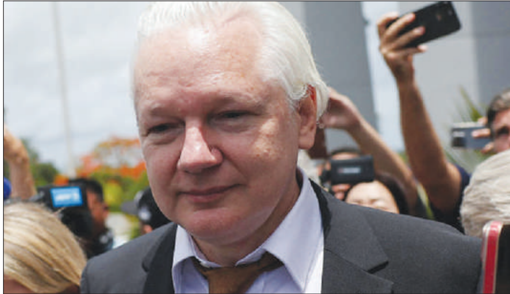
Il encourait 175 ans de prison

En effet, conformément à un accord conclu avec la justice, l'ancien informaticien âgé de 52 ans, accusé d'avoir publié des centaines de milliers de documents confidentiels américains dans les années 2010, a plaidé coupable d'obtention et de divulgation d'informations sur la défense nationale.