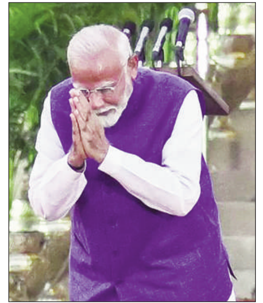
du BJP, a écrit le quotidien The Times of India.