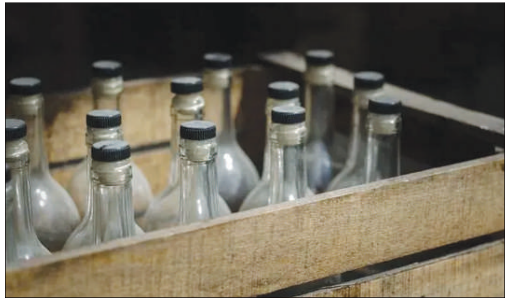
sanale avait fait sept morts à Meknès (centre) l'année dernière et 19 morts à Ksar El Kebir (nord) en 2022.

L'année dernière, 27 personnes sont mortes dans l'Etat du Bihar à cause d'un lot d'alcool frelaté, tandis qu'en 2022, au moins 42 personnes ont trouvé la mort dans un autre incident dans le Gujarat. Début juin, le même type d'intoxication s'est produit au Maroc, où huit personnes sont décédées et une centaine d'autres ont été intoxiquées dans une commune rurale au nord de Rabat. L'alcool fabriqué de manière arti-