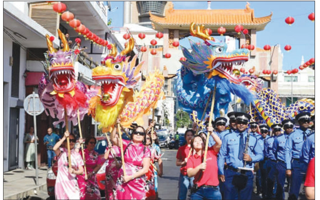
arts à s'occuper du bien-être des artistes locaux.

Par ailleurs, le ministre a insisté sur l'ensemble des mesures déployées par le gouvernement pour promouvoir les talents locaux, revaloriser le statut des artistes et leur permettre de vivre de leur créativité. Celles-ci, a-t-il souligné, comprennent l'élaboration du projet de loi sur le statut de l'artiste, la création du Fonds de protection des artistes et l'habilitation du Conseil des