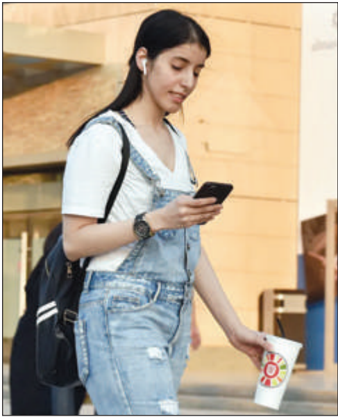
Une militante des droits des femmes a été condamnée dans le secret à 11 ans de prison pour des accusations liées au

«terrorisme», ont dénoncé mardi deux ONG de défense des droits humains.