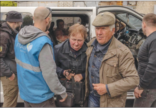
qu'à 30 kilomètres de la frontière russe.

Selon les rapports des médias, l'Ukraine a déclaré vendredi que la Russie avait lancé une attaque dans la région de Kharkiv, faisant de petites avancées dans une zone frontalière d'où elle avait été repoussée il y a près de deux ans. La région de Kharkiv, la deuxième ville d'Ukraine, qui comptait 1,5 million d'habitants avant la guerre, ne se situe