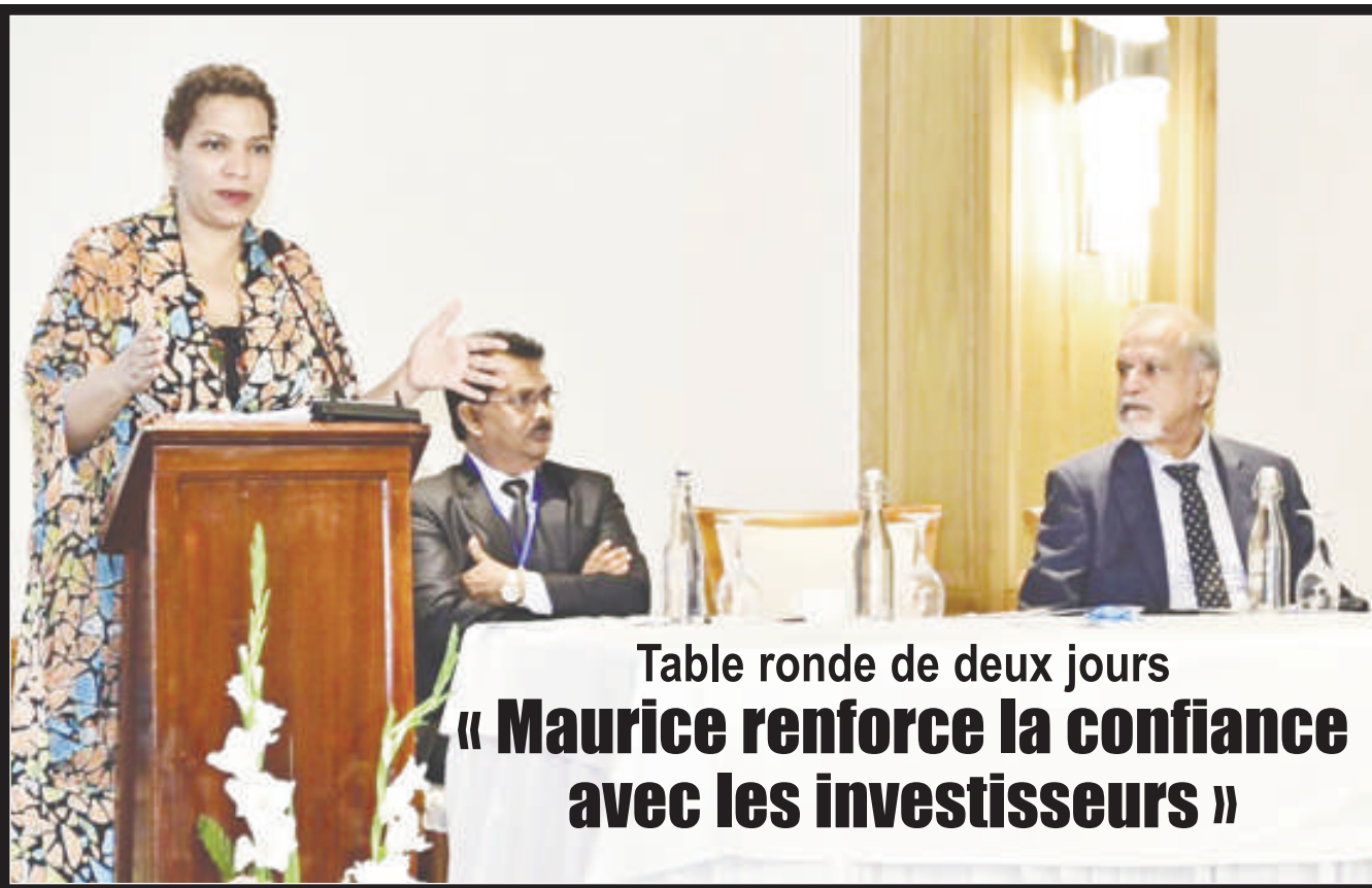
Table ronde de deux jours « Maurice renforce la confiance avec les investisseurs »