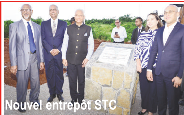
Nouvel entrepôt STC