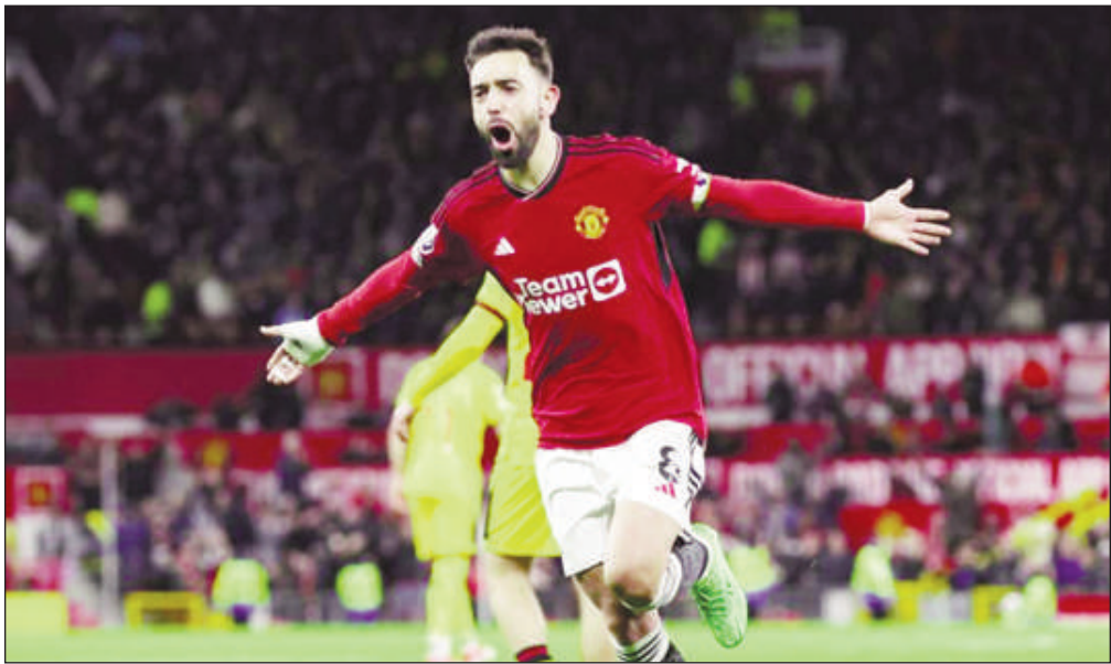
Bruno Fernandes (Man Utd)

Malgré tout, cela s'est transformé en une bonne soirée pour Man Utd. La défaite 2-0 de Newcastle à Crystal Palace signifie qu'ils se hissent à la sixième place du classement et qu'une place en UEFA Europa League est à nouveau entre leurs mains. Ce n'est pas là où un club de la taille de United veut être, mais pendant longtemps mercredi, il a semblé que les choses allaient être bien pires.